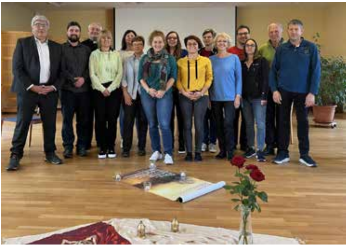
PGR Einkehrtage 2022