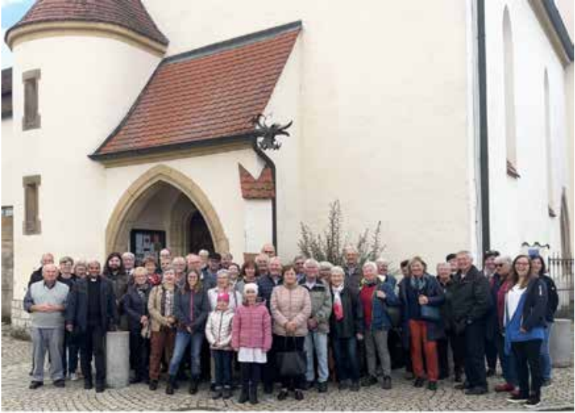
Gruppenbild: Wallfahrt nach Mindelstetten/Bettbrunn