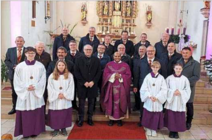
Der Männergesangverein umrahmte den Gottesdienst am zweiten Adventssonntag musikalisch.